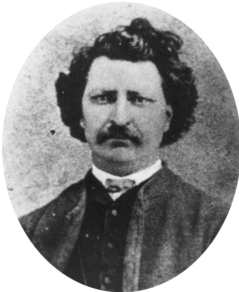
Louis Riel.