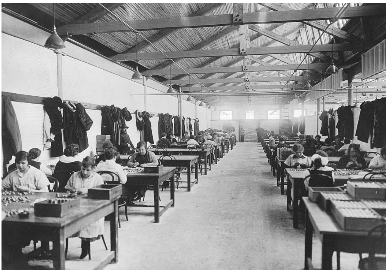
Femmes au travail, International Manufacturing Co., Montréal, QC, 1914-1918.